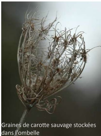
Graines de carotte sauvage stockées dans l'ombelle

Avant le stockage et le partage des graines via la grainothèque, il convient de bien sécher ses récoltes. L'idéal est de les étaler, sur du papier journal, dans un endroit sec, à l'abri du soleil, pendant une à trois semaines.