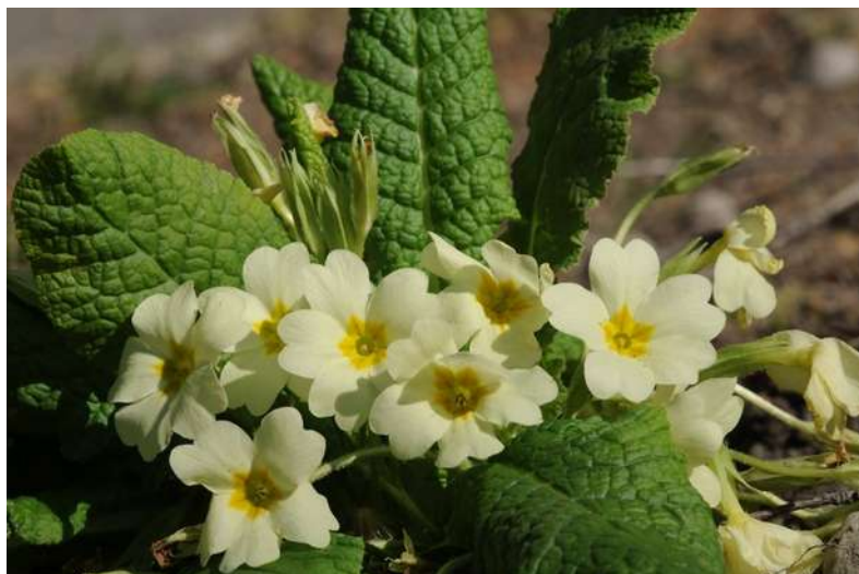
La primevère vulgaire, une plante sauvage aux nombreuses variétés horticoles.